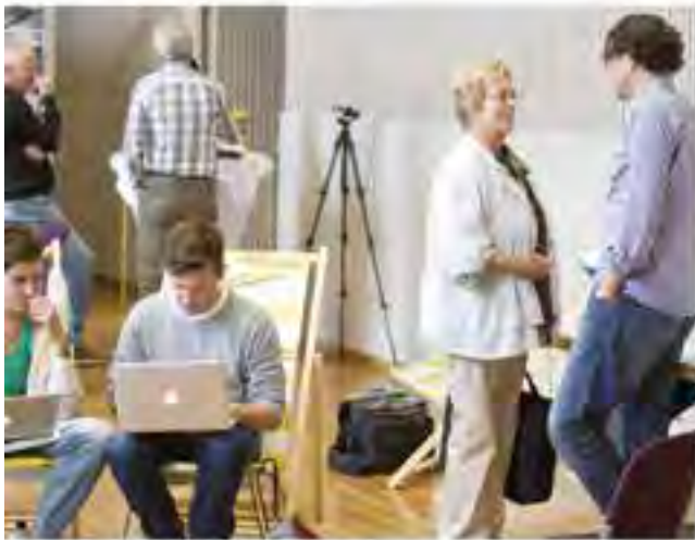
Arbeiten im Offenen Ideenbüro

Das Team der nonconform Ideenwerkstatt ist drei Tage lang für Sie da - auf der Suche nach Ihren Ideen, Visionen und vielen guten Gesprächen.