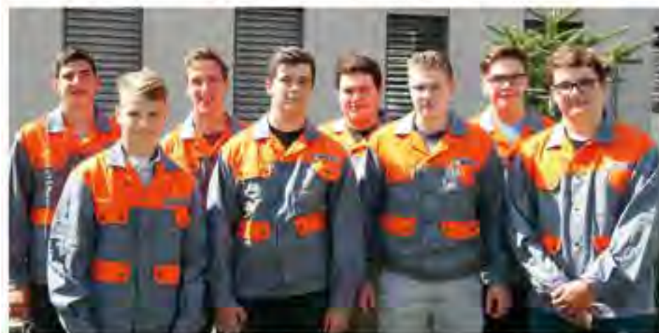
Der erste Arbeitstag der neuen Mondl-Lehrlinge.

Die Lehrlingsausbildung ist ein Teil der umfassenden Aus- und Weiterbildungsprogramme bei Mondl Frantschach. „Kompetenz und Qualität sind der Schlüssel unserer hohen Produkt- und Servicequalität. Deshalb hat regelmäßige Qualifikation bei uns höchsten Stellenwert“, hebt Joham hervor. Und dass „Karriere mit Lehre“ bei Mondl Frantschach Realität ist, davon zeugen zahlreiche erfolgreiche Berufslaufbahnen im Betrieb.