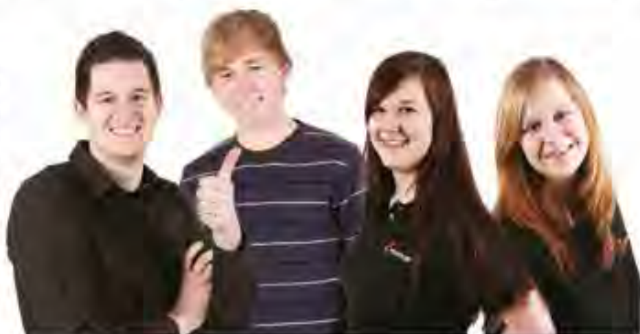
2008 als Lehrlinge gestartet – bis heute bei Mondl Frantschach.

Die Lehrplätze bei Mondl Frantschach sind äußerst begehrt, es gibt deutlich mehr Nachfrage als Lehrstellenangebote. Das große Interesse ist verständlich, denn schließlich winkt ein Arbeitsplatz in einem weltweit agierenden Unternehmen mit rund 25.000 Beschäftigten. Entsprechend anspruchsvoll und abwechslungsreich ist deshalb auch der Weg bis zum Lehrabschluss in den Bereichen Metall- bzw. Elektrotechnik, Chemielabortechnik und Einkauf. Speziell die Ausbildung in der Metall- bzw. Elektrotechnik erfolgt in enger