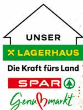
Roland - Gartenabteilung H&G Wolfsberg

Freude schenken! Lagerhaus Gutscheine zum Tanken und Einkaufen